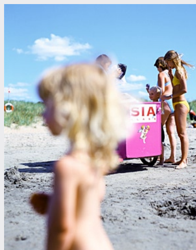
Links: Durch die Dünen an den Strand