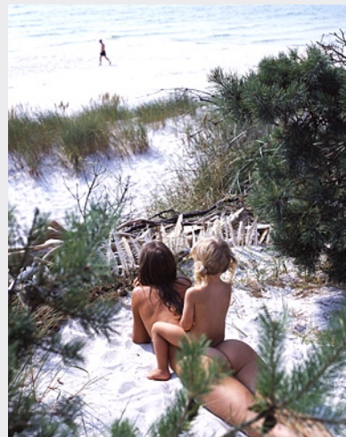
Links: Baden in der Nordsee