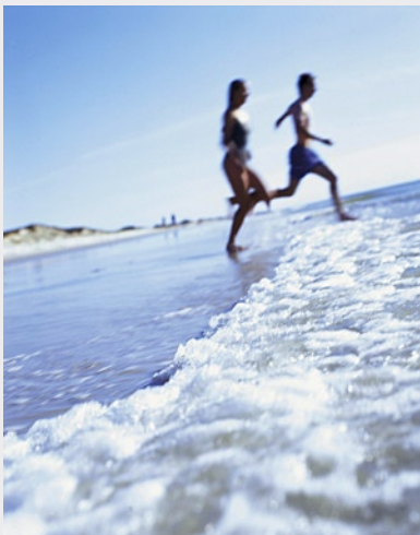
Rechts: Westerland auf Sylt