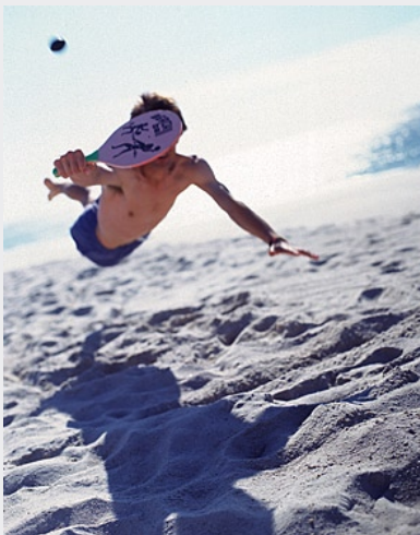
Rechts: Badetag an der schwedischen Westküste