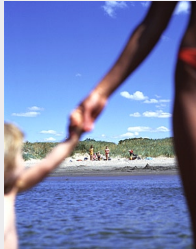
Links: Sandspiele an der Ostsee