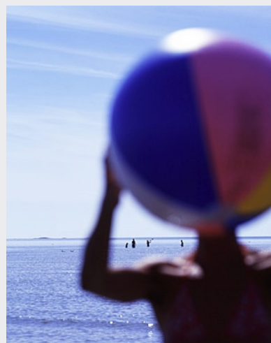
Links: Strandmode in Schweden